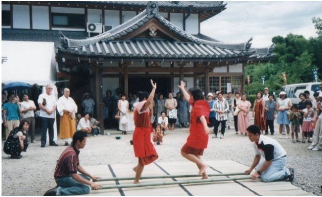
Danza filippina in un tempio buddista

La presenza marista in Giappone è iniziata con una promessa visionaria fatta da Padre Lionel Marsden nel campo di concentramento di Changi: l'impegno di tornare dai suoi ex carcerieri non con inimicizia, ma con la Buona Novella della riconciliazione. Per me, questo si è trasformato in un cammino di comunione interculturale e di servizio silenzioso,