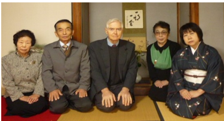
I preparativi per una cerimonia del tè (d'addio) nel 2013!