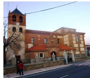
Trobaio del Camino